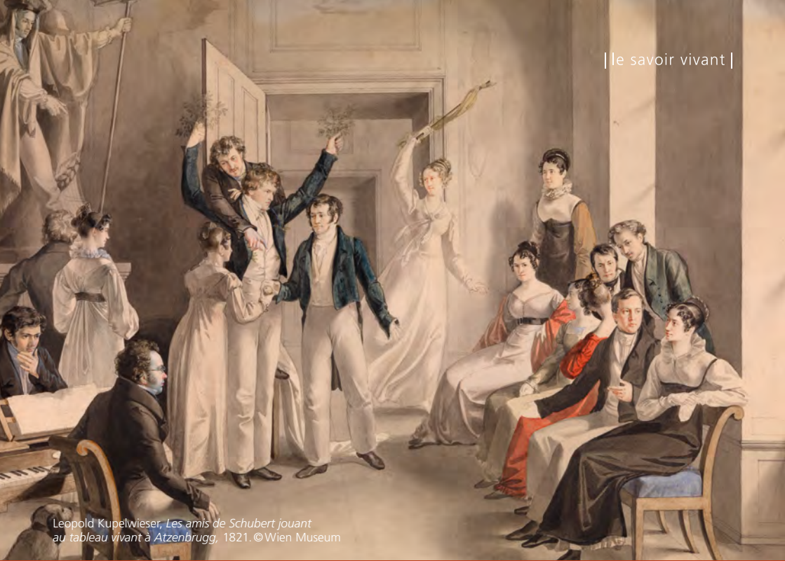
Leopold Kupelwieser, Les amis de Schubert jouant au tableau vivant à Atzenbrugg , 1821.